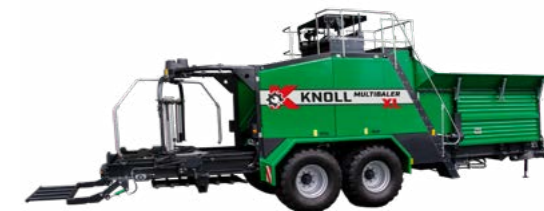
KNOLL MultiBaler XL