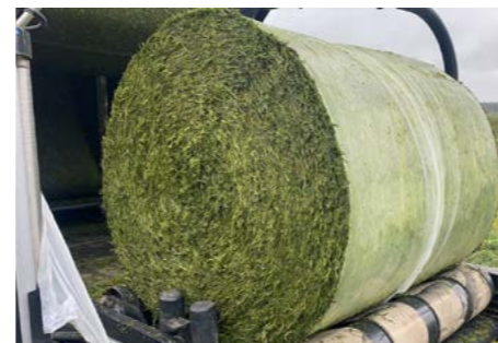
GPS (Gehele Plant Silage)