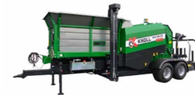
KNOLL MultiBaler 1220