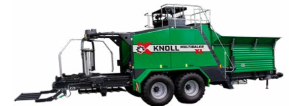
KNOLL MultiBaler XL