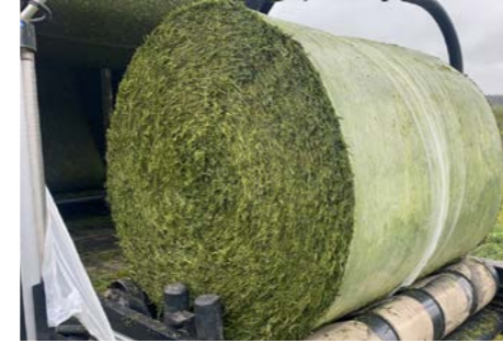
GPS (Gehele Plant Silage)