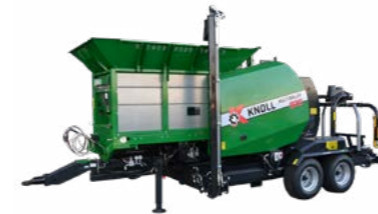
KNOLL MultiBaler 820