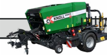
KNOLL MidiFix II