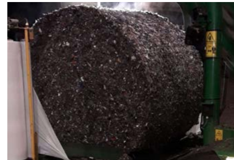
RDF / Afval

Voorbeelden van andere materialen welke verwerkt kunnen worden met een KNOLL MultiBaler XL.