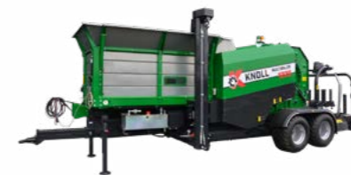
KNOLL MultiBaler 1220