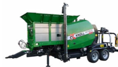
KNOLL MultiBaler 820