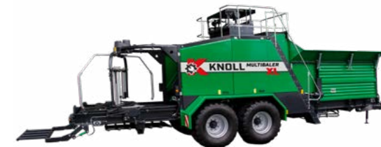
KNOLL MultiBaler XL