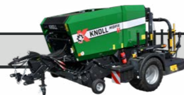
KNOLL MidiFix II