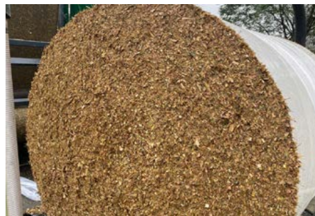
TMR ( Gesamtmischverhältnis )