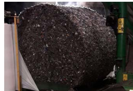
RDF (Abfall )

Beispiele für andere Materialien, die mit einer KNOLL MultiBaler 820 gepresst werden können.