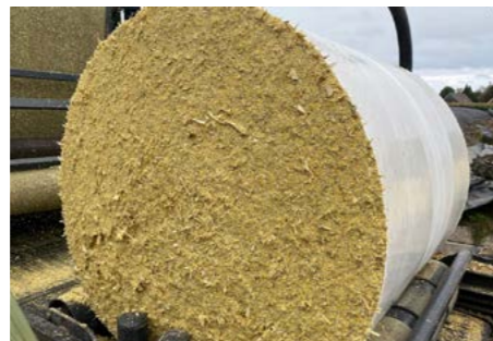
CCM ( Maiskolbenschrott )