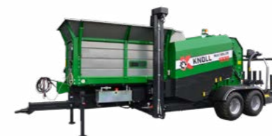
KNOLL MultiBaler 1220