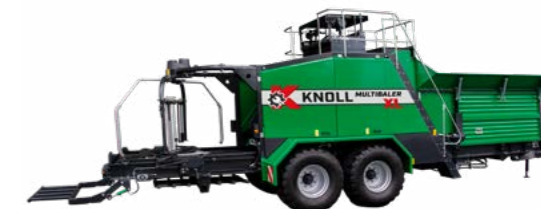
KNOLL MultiBaler XL