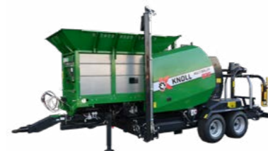
KNOLL MultiBaler 820